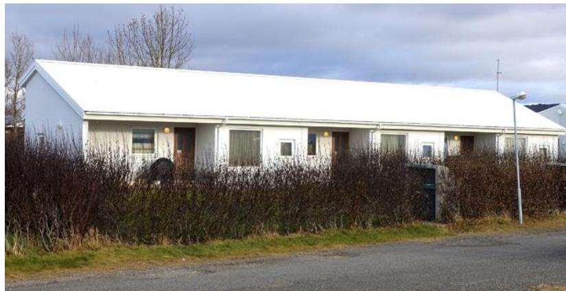
Hvanneyrargata 6 - Hvanneyrargata 8 og Túngata 22 eru eins skipulögð hús og eru 3ja herb. íbúðirnar lengst til vinstri