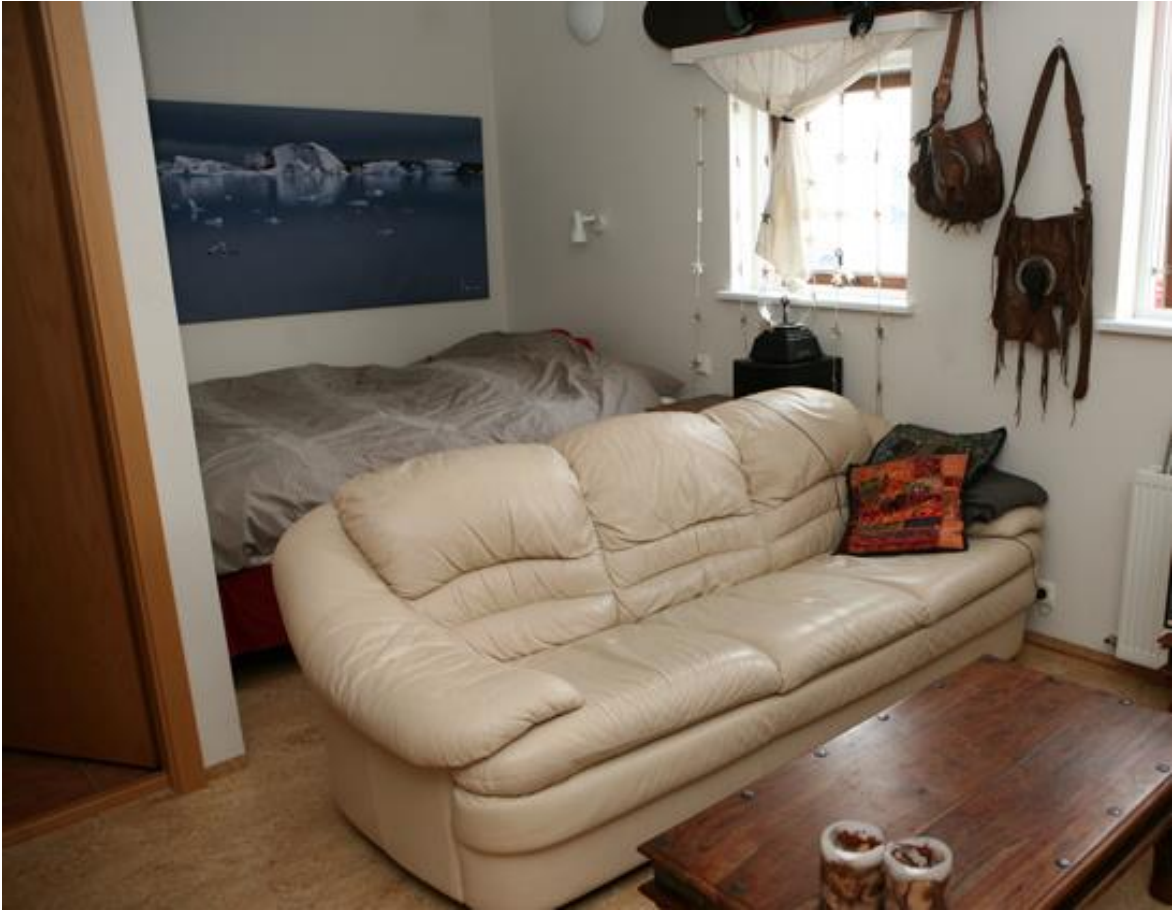
Dæmi um uppröðun húsgagna í stúdíóbúð nemendagarðanna