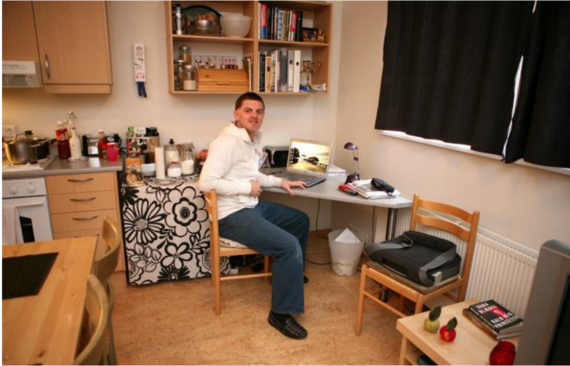
Lært við veggfest hornborð sem fylgir með stúdíóbúðunum