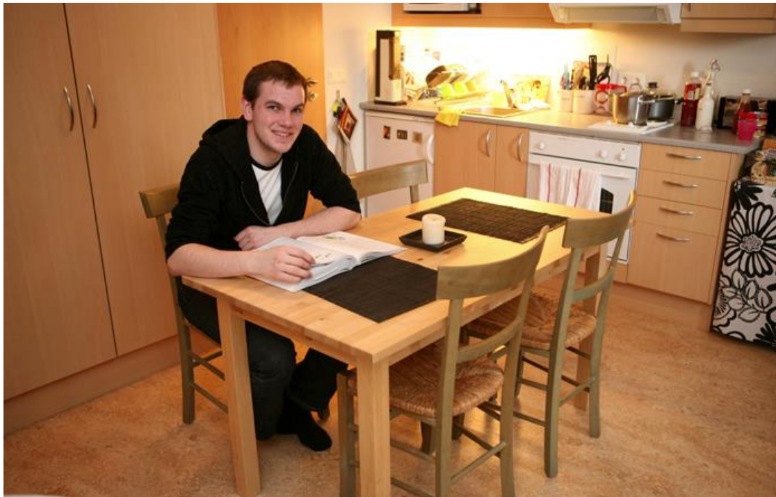
Vel er hægt að koma fyrir nettu eldhúsborði í stúdíóbúð