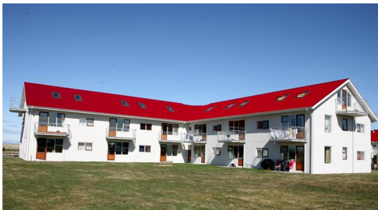
Skólaföt 7 – blokkirnar fjórar eru allar eins í útliti