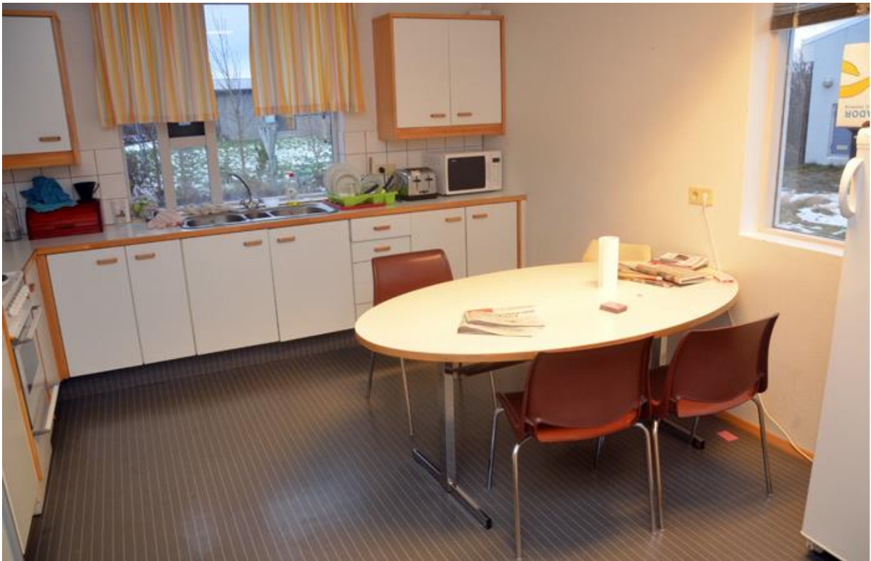
Sameiginlegt eldhús í Hlégarði (Hvanneyrargötu 4).