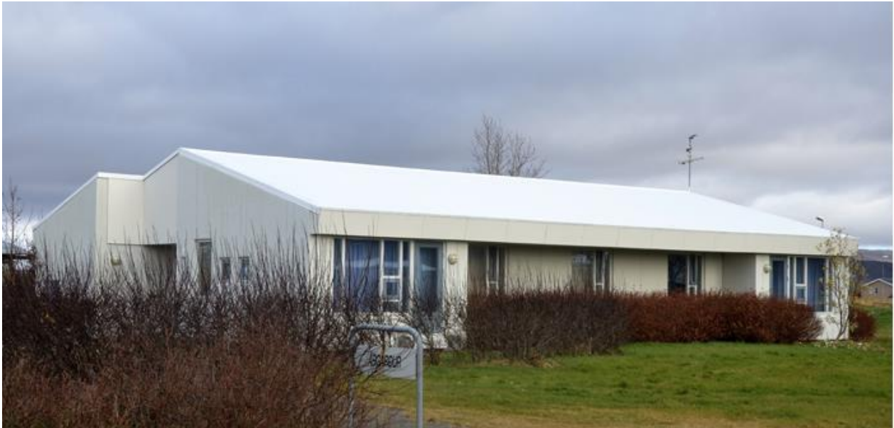
Árgarður (Hvanneyrargata 2). Hlégarður hefur samskonar útlit.